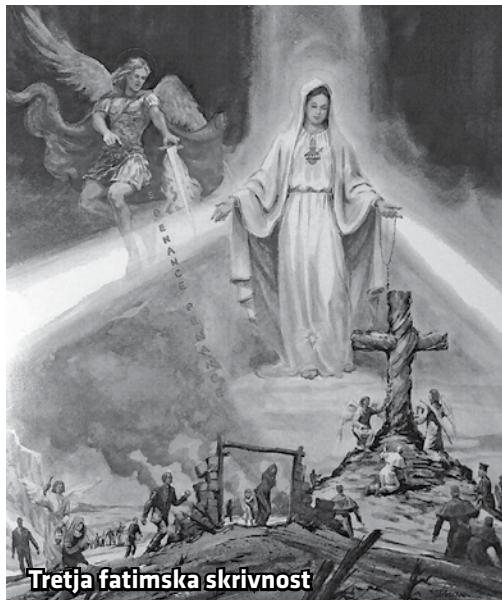
Tretja fatimska skrivnost