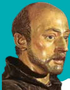
sv. Ignacij Lojolski